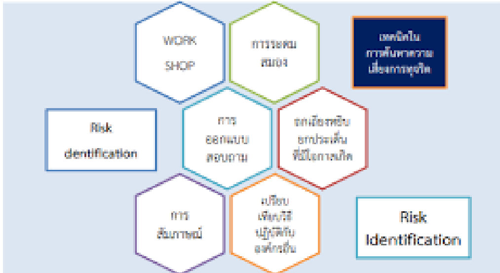
ตารางที่ ๑ ระบุความเสี่ยง

เทคนิคในการ ระบุความเสี่ยง หรือค้นหาความเสี่ยงการทุจริตด้วยวิธีการต่าง ๆ ดังนี้